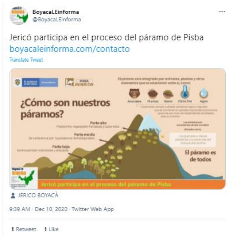
Imagen 3. Evidencia apoyo en la difusión de información por parte del municipio de Jericó

Al contestar por favor cite estos datos: