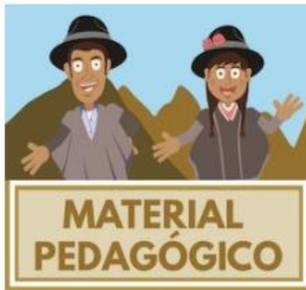
Imagen 1. Botón material pedagógico, minisitio ‘Pisba Avanza’