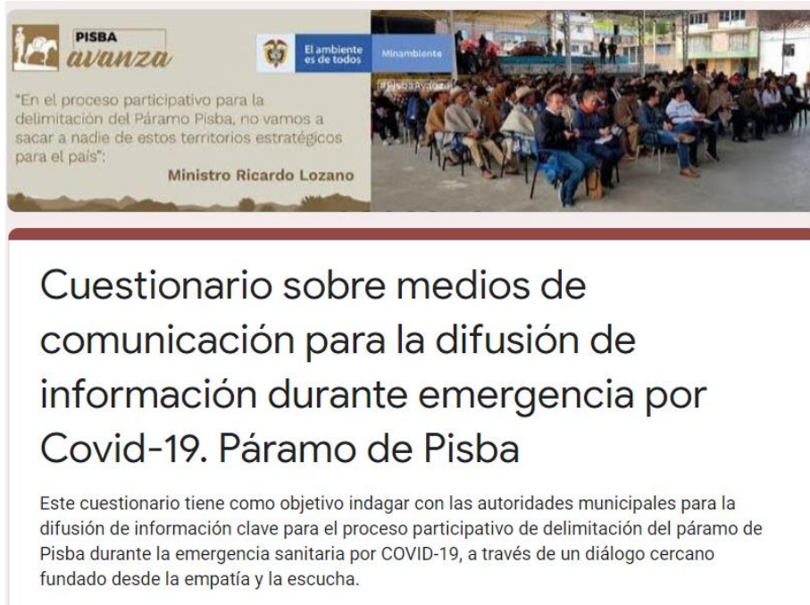
Ilustración 1. Apariencia “Cuestionario sobre medios de comunicación para la difusión de información durante emergencia por Covid-19. Páramo de Pisba”

Los aspectos más relevantes de la información recolectada se condensan, a continuación: